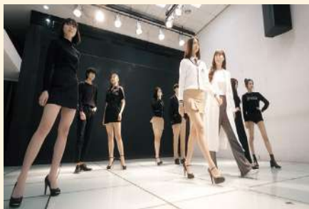
모델 실습실 (아라모드)