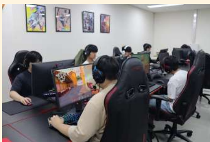
e스포츠 실습실 (아레나)