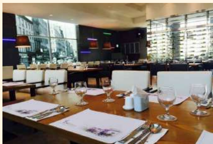
호텔경영, 호텔조리 실습실 (42번가)