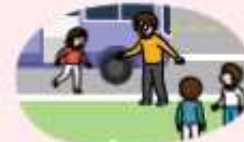
현장학습 등 차를 타고 이동 중에는 가까운 공터, 도로 오른쪽 정차 후 안전한 곳으로 대피