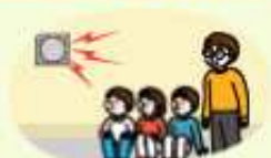
교내 방송 또는 라디오 방송 잘 듣기