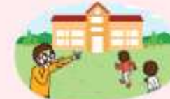
운동장 등 실외활동 시 실내 또는 지정된 대피 장소로 신속히 이동