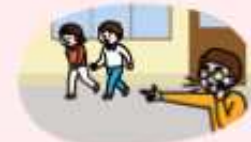
선생님과 지정된 대피장소로 이동