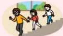
계단을 이용하고 뛰거나 뛰지 않기 (엘리베이터 이용 금지)