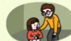
마음이 불안한 학생은 선생님에게 알리기