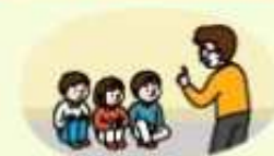
대피장소에 머물며 침착하게 행동하기