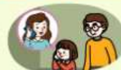
선생님 안내에 따라 부모님께 연락하기