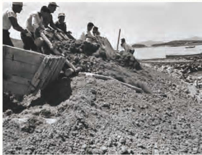
계화도 간척사업 사진 界火島干拓事業寫眞