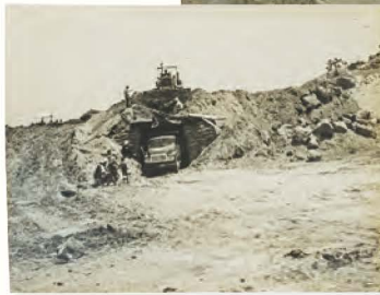
동진강 간선수로 공사 東津江幹線水路工事