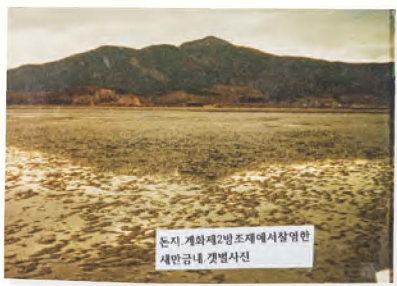
계화-돈지 제2방조제에서 촬영한 갯벌 사진