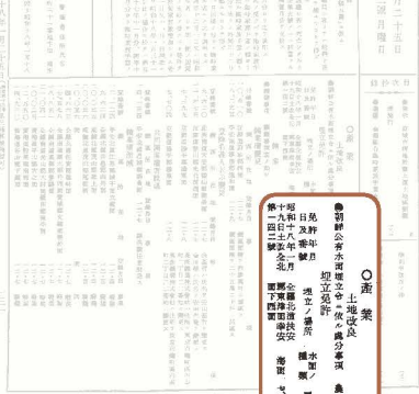
조선총독부 관보 朝鮮總督府官報