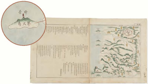
전라남북도여지도 全羅南北道輿地圖