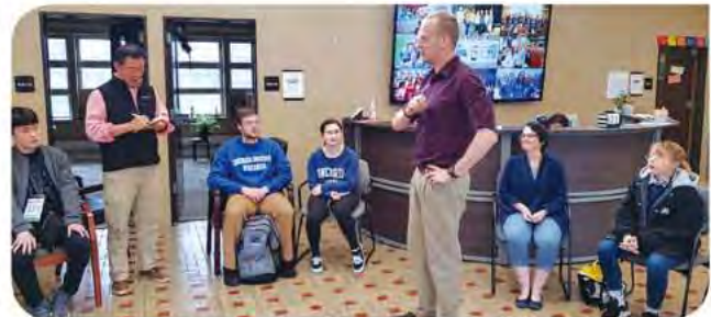
▶ 미국 PACE교육 체험을 위한 해외단기연수