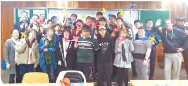
▶ 대구대 원어민교수와 함께하는 영어회화