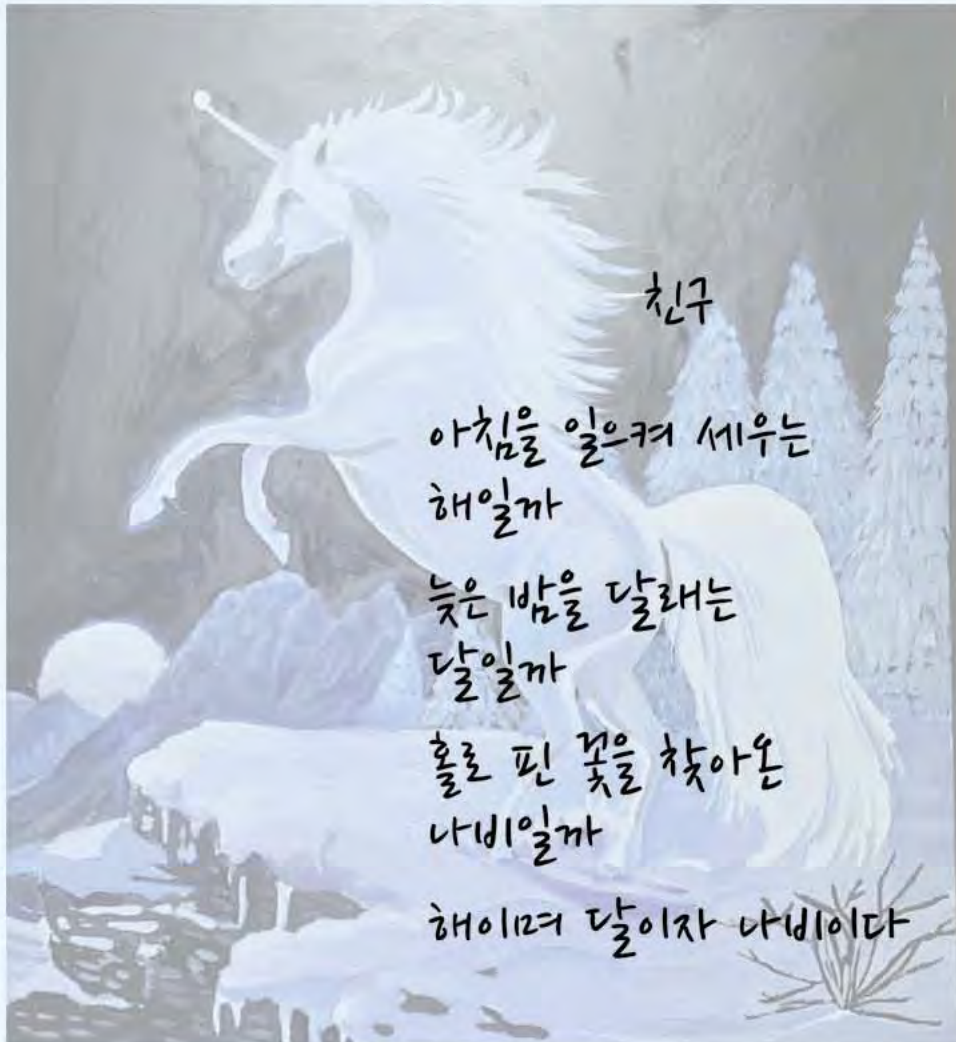
그림: K-PACE 졸업생 김은규