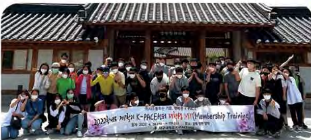
▶ 사회성 향상 프로그램