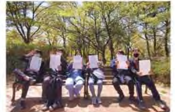
▶ 사회증진기술 프로그램