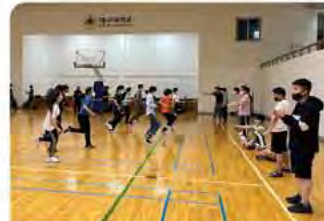
▶ 뉴 스포츠