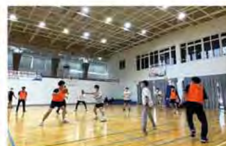
▶ The Key key, Key농구단