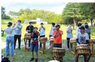
▶ 동아리 활동(난타공연)