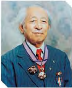
대구대학교 설립자 성산(惺山) 이영식 목사

대구대학교 설립자인 이영식牧사는 일본 제국주의의 침탈에 항의한 독립 운동가이며 우리나라가 어렵고 힘든 시절, 그리스도의 참된 섬김과 사랑의 삶을 실천하신 분이다. 자신의 삶을 나환자와 장애인을 위해 헌신하고 그들이 당당한 인격체로 존중받고 살아갈 수 있는 터전을 마련해 주었다.