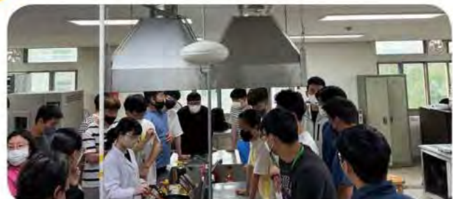
▶ 식품영양학과와 함께하는 요리실습