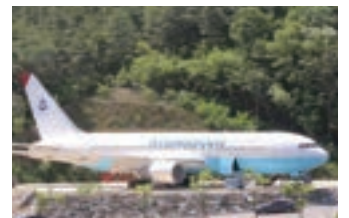
항공종합실습교육센터 [보잉 - 767]