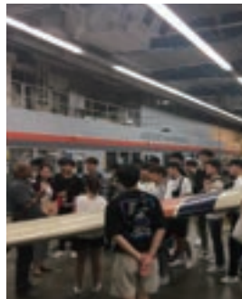
해외 현장체험 프로그램