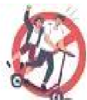
< 2인이상 승차 >