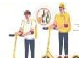
< 음주운전 >