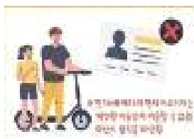
< 무면허 운전 >