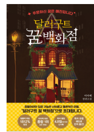
2023년 달려구트 꿈백화점 (청소년)