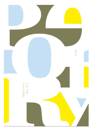
2023년 시와 산책 (성인)