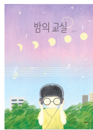
2023년 밤의 교실 (어린이)