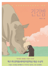
2022년 긴긴밤 (청소년)