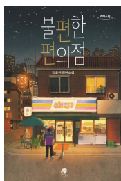
2022년 불편한 편의점 (성인)