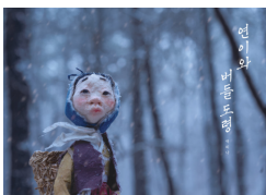
2022년 연이와 버들도령 (어린이)