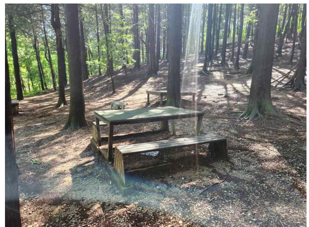
[현장사진] 건지산 편백나무숲 일대