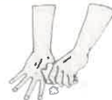
④ 손가락 돌려 씻기