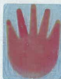
〈비누로 씻었을 때〉