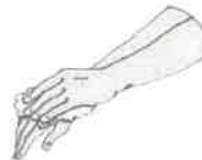
③ 손바닥, 손등 문지르기