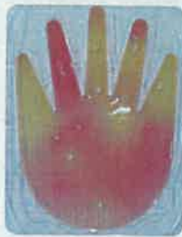
〈물로만 씻었을 때〉