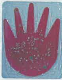
〈손 씻기 전〉