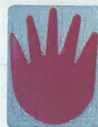
〈소독까지 했을 때〉