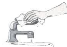
⑧ 종이 타월로 수도꼭지 잠그기