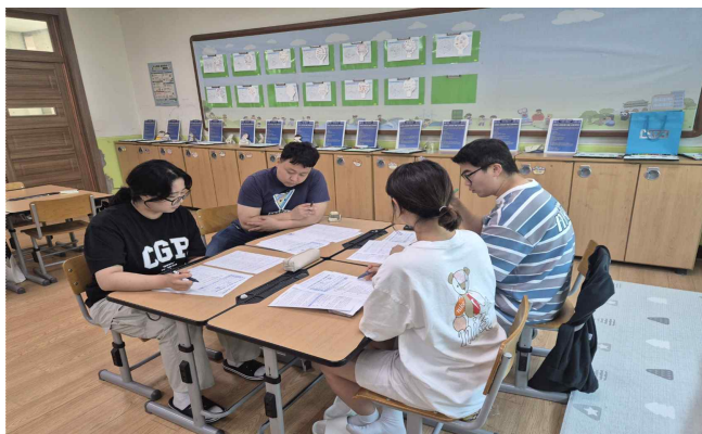
6월 18일 전문적학습공동체 협의