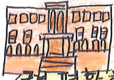
국립 평화 학교

이 노동당사 건물을 북한이 지었다는 것이 믿겨 지지 않았다. 그리고 실제로 북한 건물을 볼 수 있어 좋았고 북한과 가깝다는 것을 알 수 있었다. 또한 이곳에