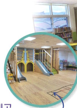
실내 누리 놀이터

※ 2022년도 기준이며 2023년도에는 시간 및 운영형태가 변경 될 수 있음