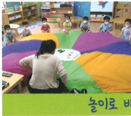
놀이를 배우는 교실