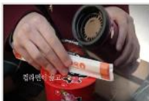
[학교2015 후아유] 학교...