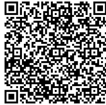
IOS 앱 다운로드 QR