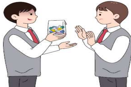
마약류 범죄 연루