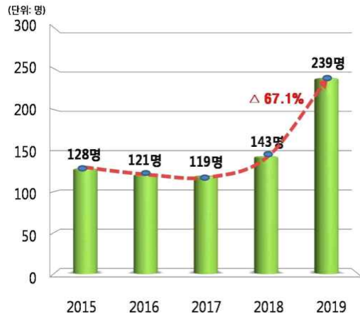
<청소년 마약류사범 적발 추이>

※ 자료 출처 : 『2019 마약류 범죄백서』대검찰청, kbs뉴스, JTBC 뉴스