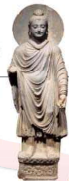
▲ 간다라 불상