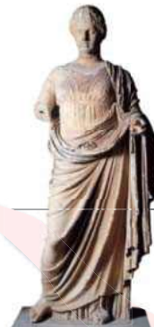
▲ 그리스의 조각상