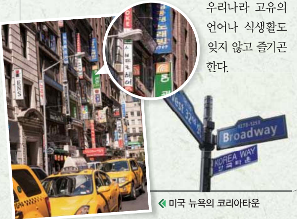
◀ 미국 뉴욕의 코리아타운

(나) 다양한 이유로 우리나라를 떠나 다른 나라에 정착한 한민족이 많다. 이들은 다른 나라에서 생활하면서 정착지의 언어나 식생활을 누리면서도 동시에 우리나라 고유의 언어나 식생활도 잊지 않고 즐기곤 한다.