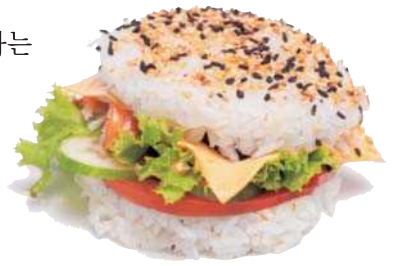
▲ 문화 융합의 사례인 라이스버거

문화 융합 문화 융합은 서로 다른 사회의 문화 요소가 결합하여 기존의 두 문화 요소와는 성격이 다른 새로운 문화가 만들어진 경우이다. 예를 들어 기존 한국의 음식 재료를 외국의 요리 방식과 결합하여 만든 새로운 융합(fusion) 음식이 이에 해당한다.