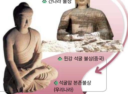
▲ 원강 석굴 불상(중국)