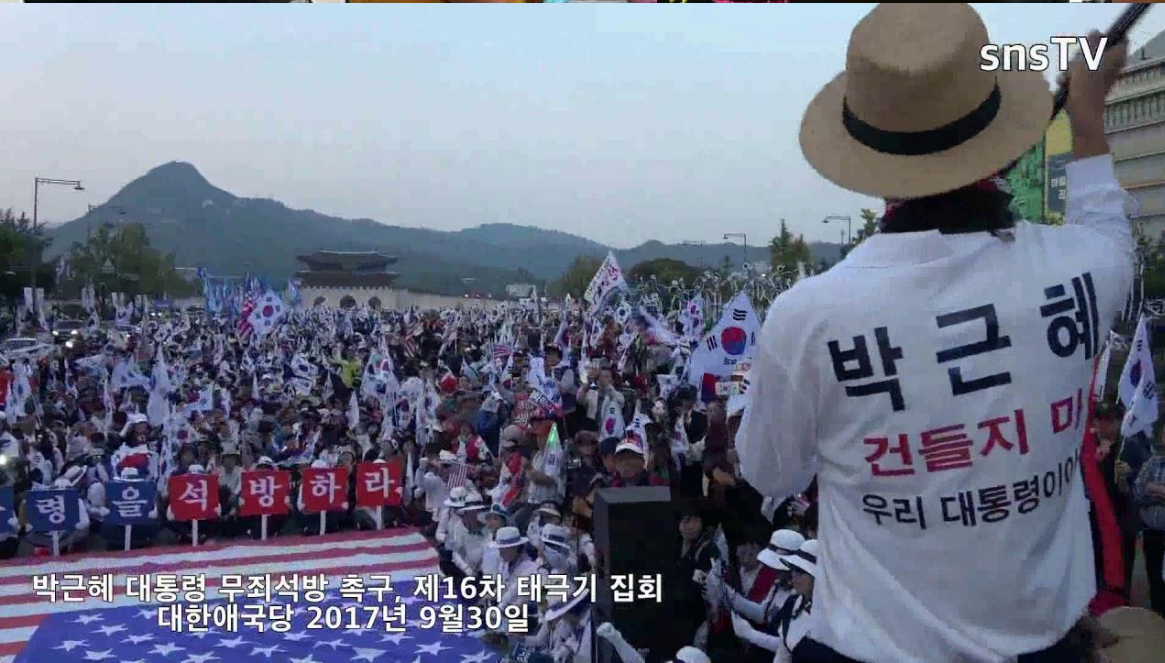
박근혜 대통령 무죄석방 촉구, 제16차 태극기 집회 대한애국당 2017년 9월30일