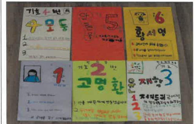
민주시민교육(선거관련 영상 시청 및 선거벽보·선거공약 만들기 체험 등)