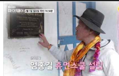
엄홍길 휴먼재단 이사장