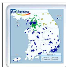
홈페이지( http://airkorea.or.kr )