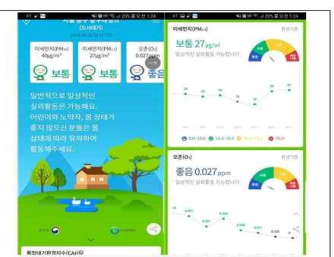
모바일 앱(우리동네 대기정보)