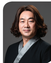
단 장 주 호 중