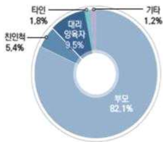
[그림 1-3-6] 학대행위자와 피해아동과의 관계

학대 행위자와 피해 아동과의 관계는 부모 25,380건 (82.1%) > 대리양육자 2,930건(9.5%) > 친인척 1,661건 (5.4%) > 타인 565건(1.8%) 등의 순으로 나타났습니다.