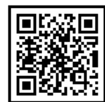
헌혈 앱 레드커넥트 (Android)

학교, 직장, 기관 등 20명 이상의 규모라면 단체헌혈 에 참여해 보세요.