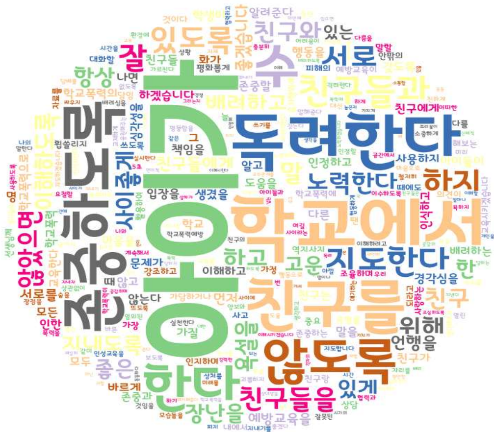
[그림: 전체 학부모 ‘학교폭력예방’ 분야 워드클라우드]