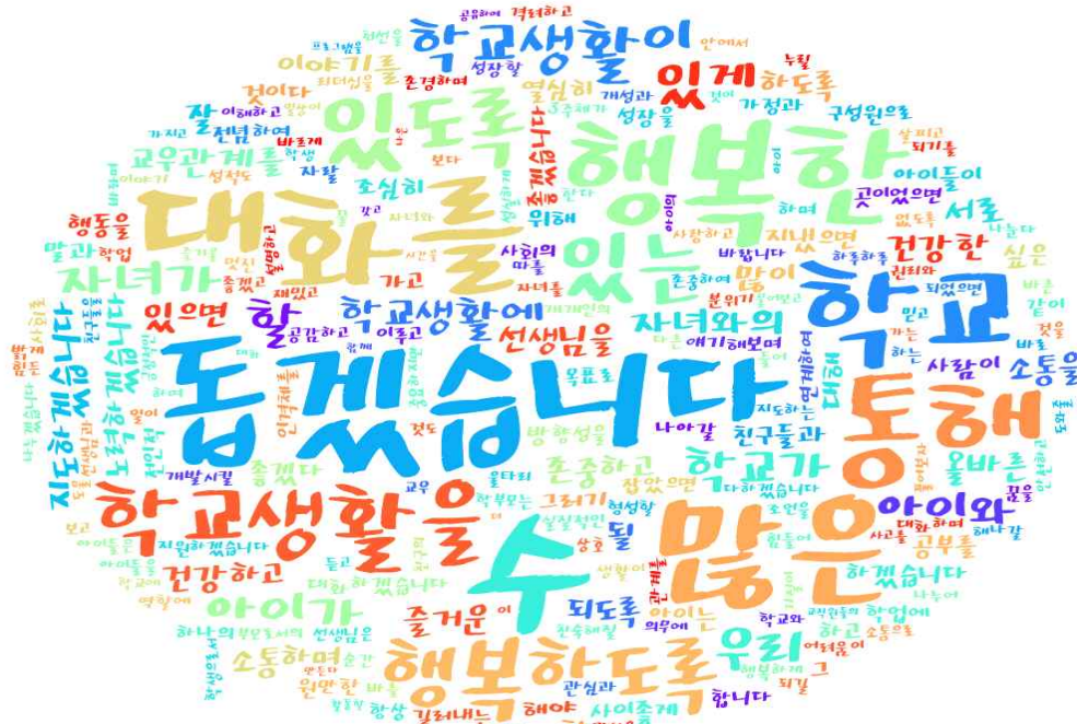
[그림: 1학년 학부모 ‘내가 바라는 바람직한 학교의 모습 및 내가 실천할 수 있는 약속’ 분야 워드클라우드]