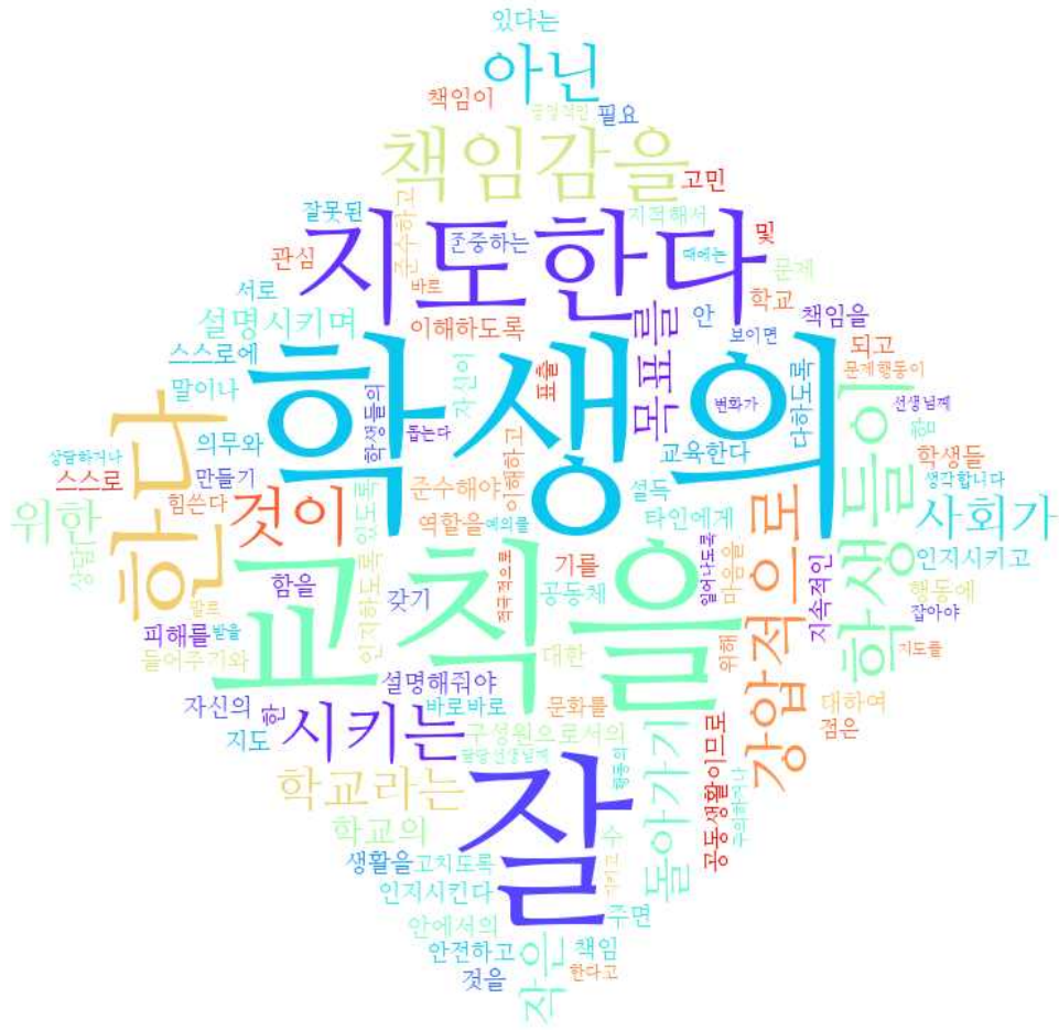
[그림: 교직원 ‘학생생활지도 이해’ 분야 워드클라우드]