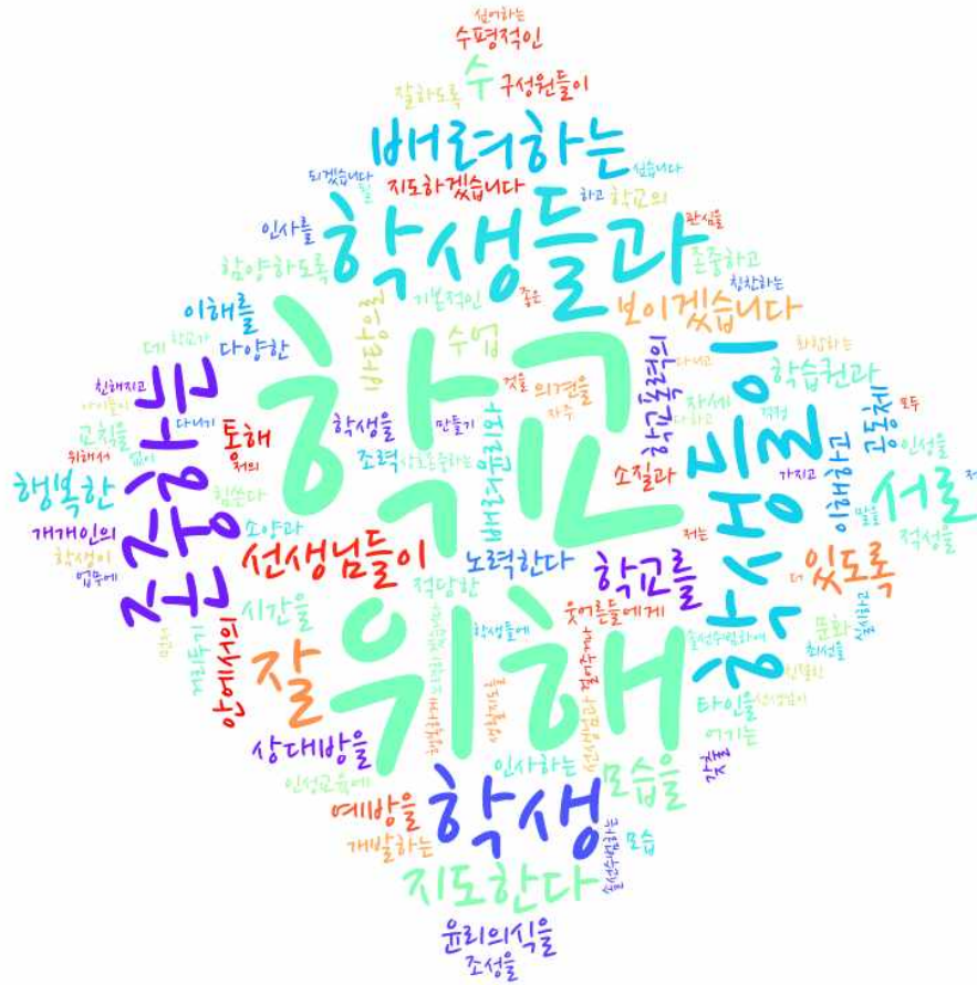
[그림: 교직원 ‘내가 바라는 바람직한 학교의 모습 및 내가 실천할 수 있는 약속’ 분야 워드클라우드]