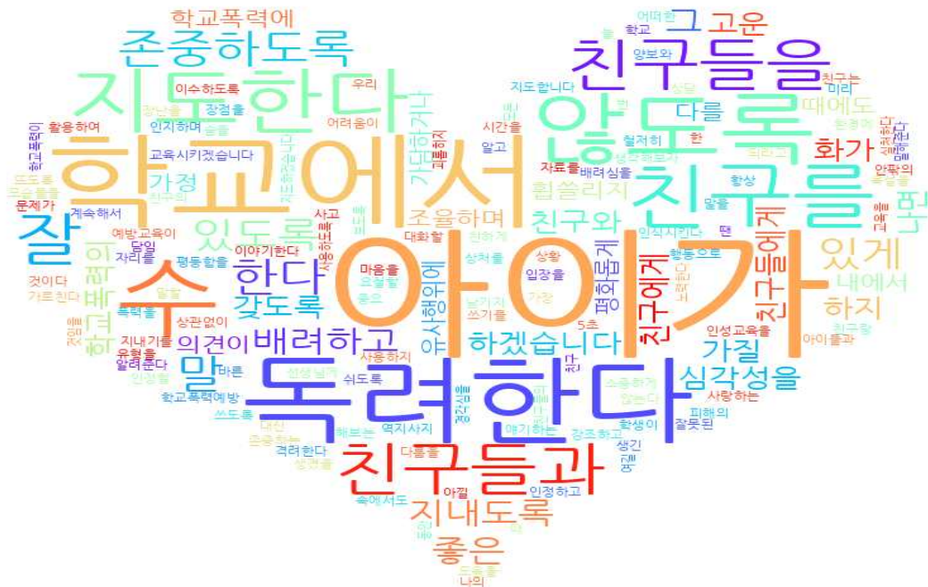
[그림: 1학년 학부모 ‘학교폭력예방’ 분야 워드클라우드]