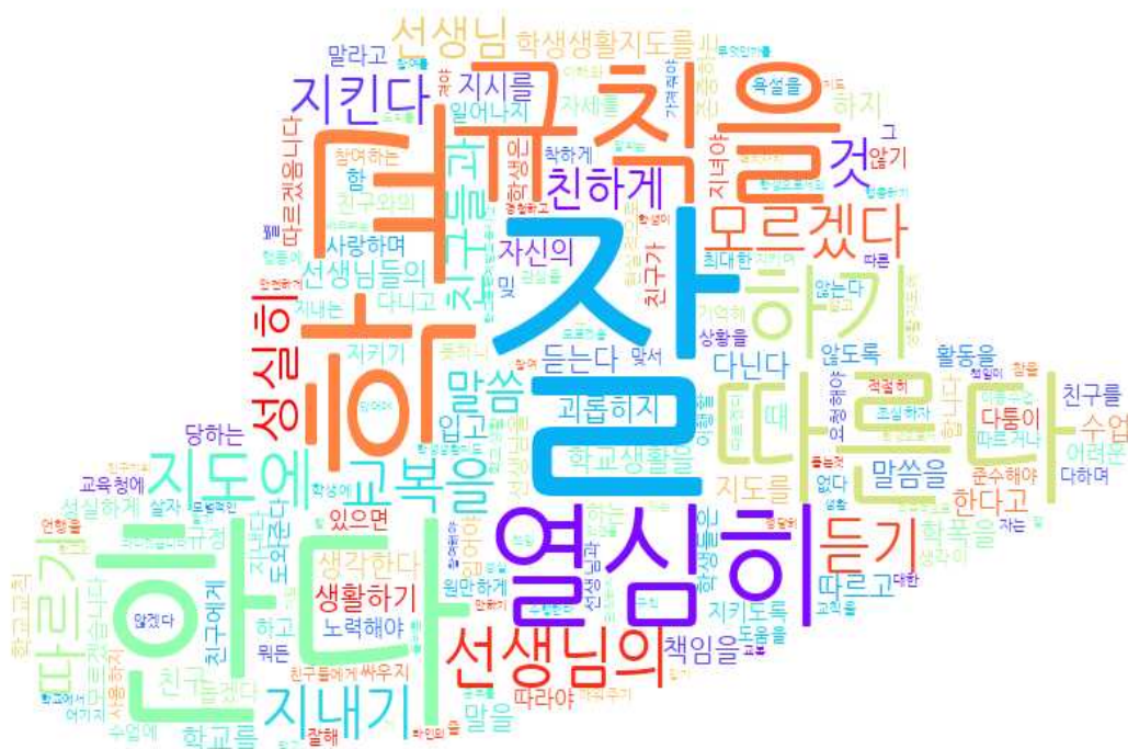
[그림: 전체 학생 ‘학생생활지도 이해’ 분야 워드클라우드]