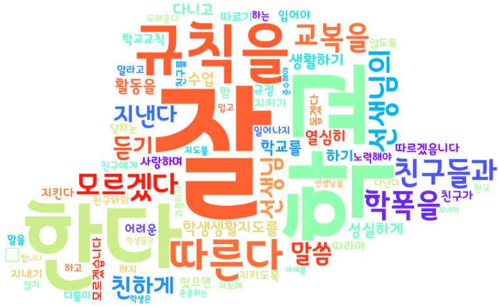
[그림: 1학년 학생 ‘학생생활지도 이해’ 분야 워드클라우드]