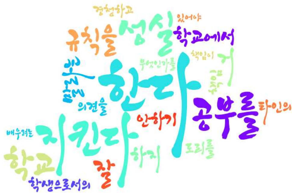
[그림: 3학년 학생 ‘학생생활지도 이해’ 분야 워드클라우드]