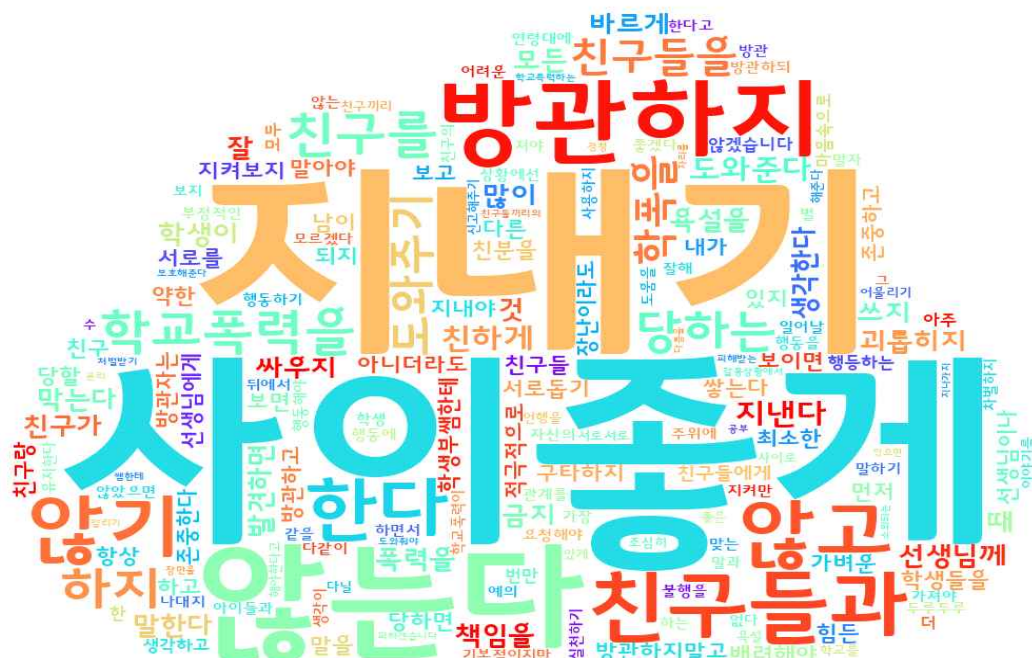
[그림: 전체 학생 ‘학교폭력예방’ 분야 워드클라우드]