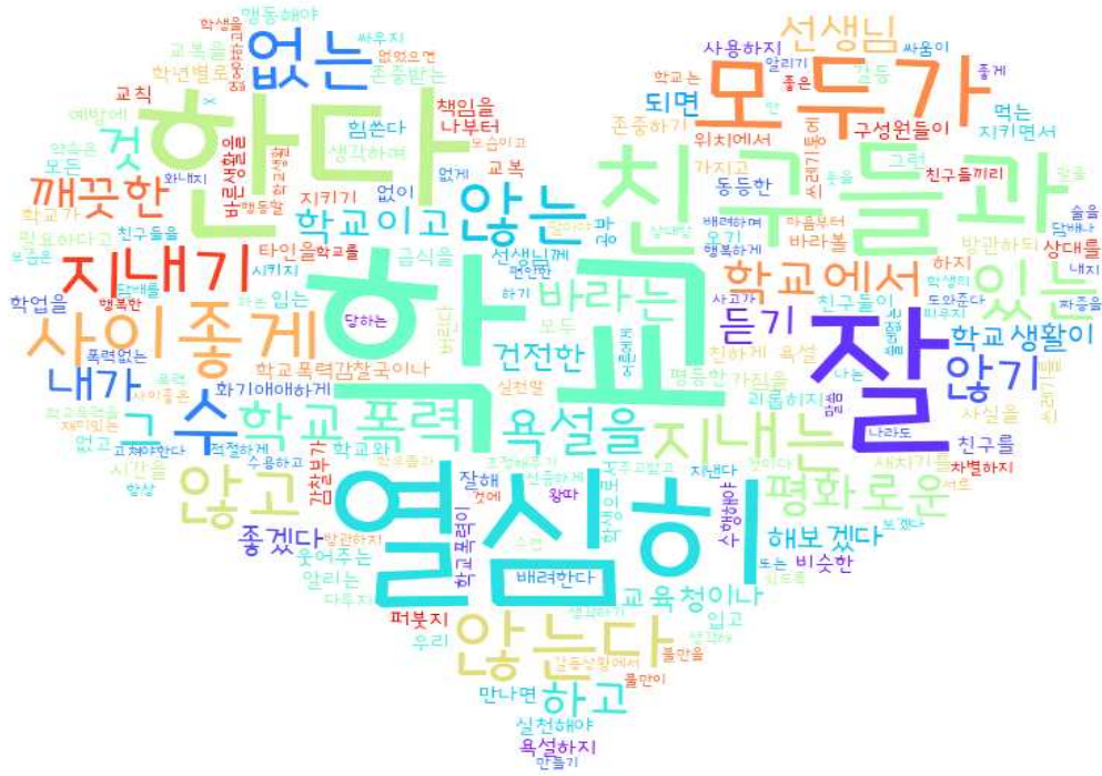
[그림: 2학년 학생 ‘내가 바라는 바람직한 학교의 모습 및 실천 약속’ 분야 워드클라우드]