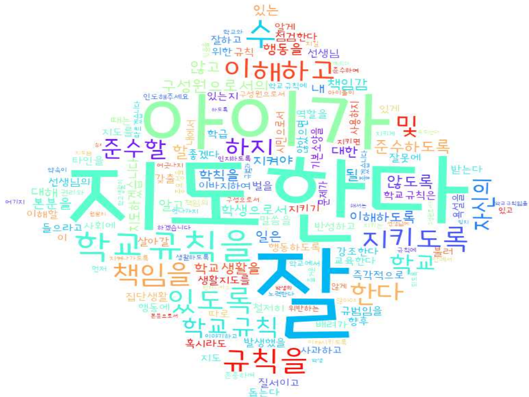
[그림: 2학년 학부모 ‘학생생활지도 이해’ 분야 워드클라우드]