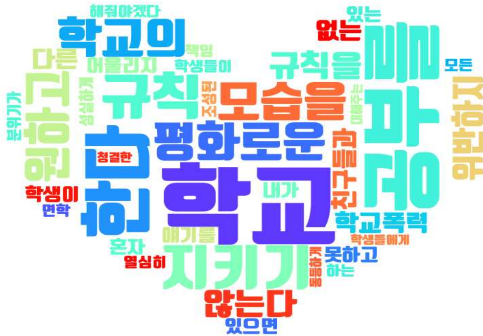
[그림: 3학년 학생 ‘내가 바라는 바람직한 학교의 모습 및 실천 약속’ 분야 워드클라우드]