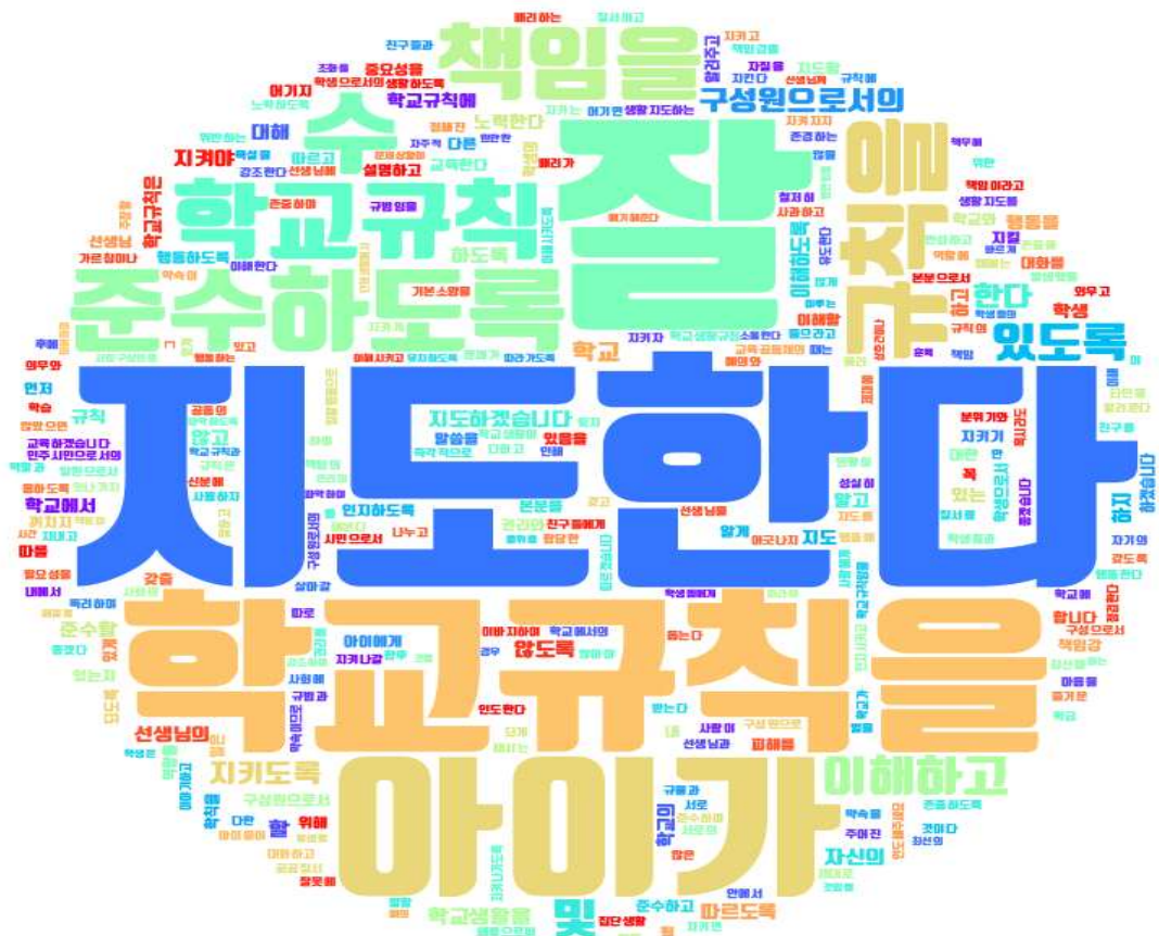
[그림: 전체 학부모 ‘학생생활지도 이해’ 분야 워드클라우드]