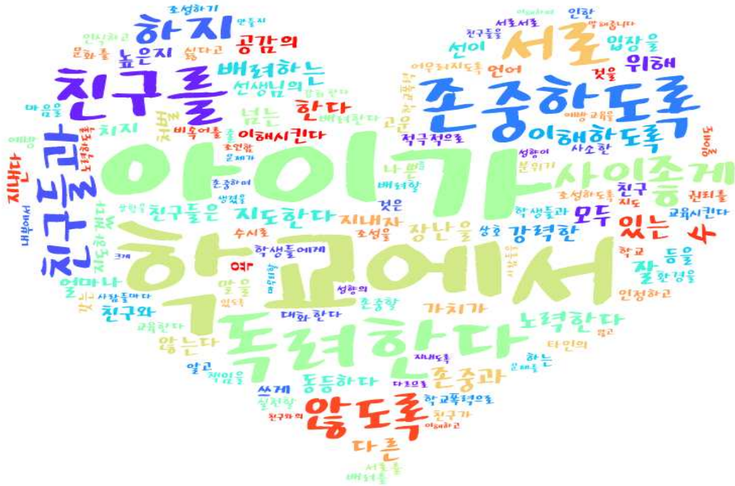
[그림: 3학년 학부모 ‘학교폭력예방’ 분야 워드클라우드]