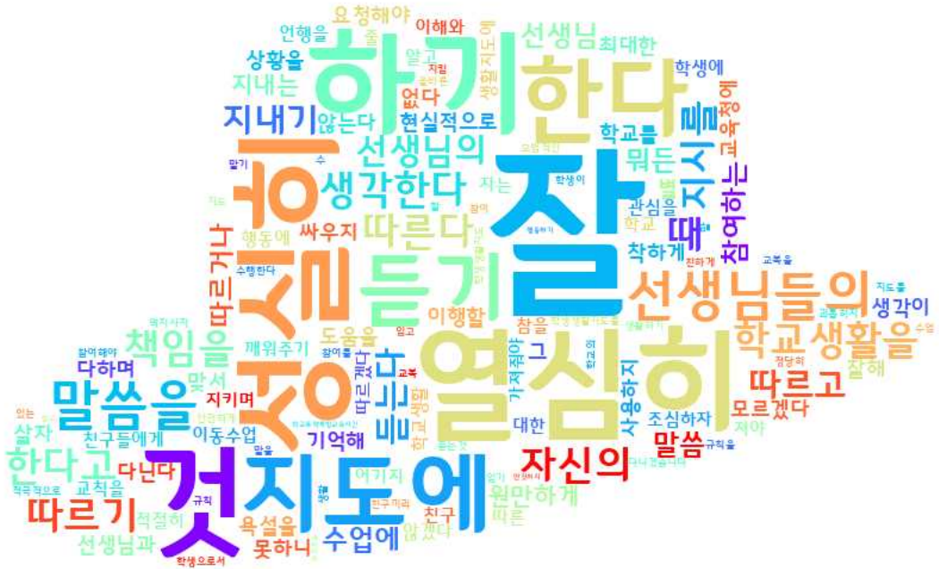
[그림: 2학년 학생 ‘학생생활지도 이해’ 분야 워드클라우드]