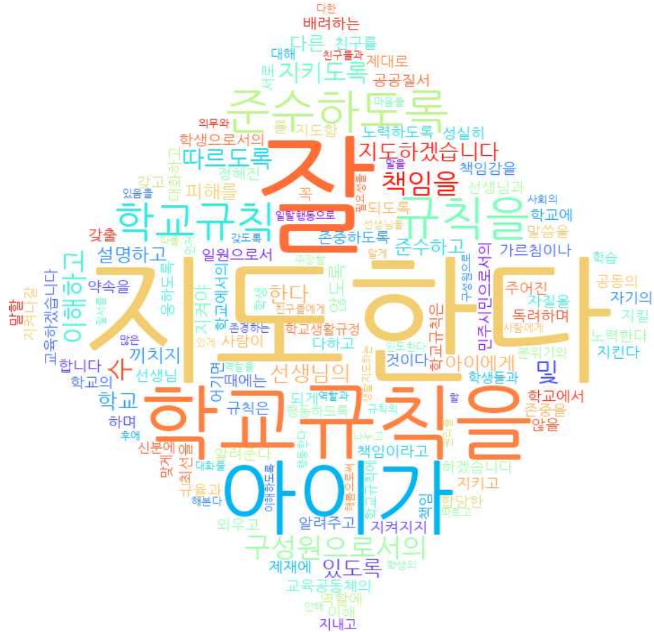
[그림: 1학년 학부모 ‘학생생활지도 이해’ 분야 워드클라우드]