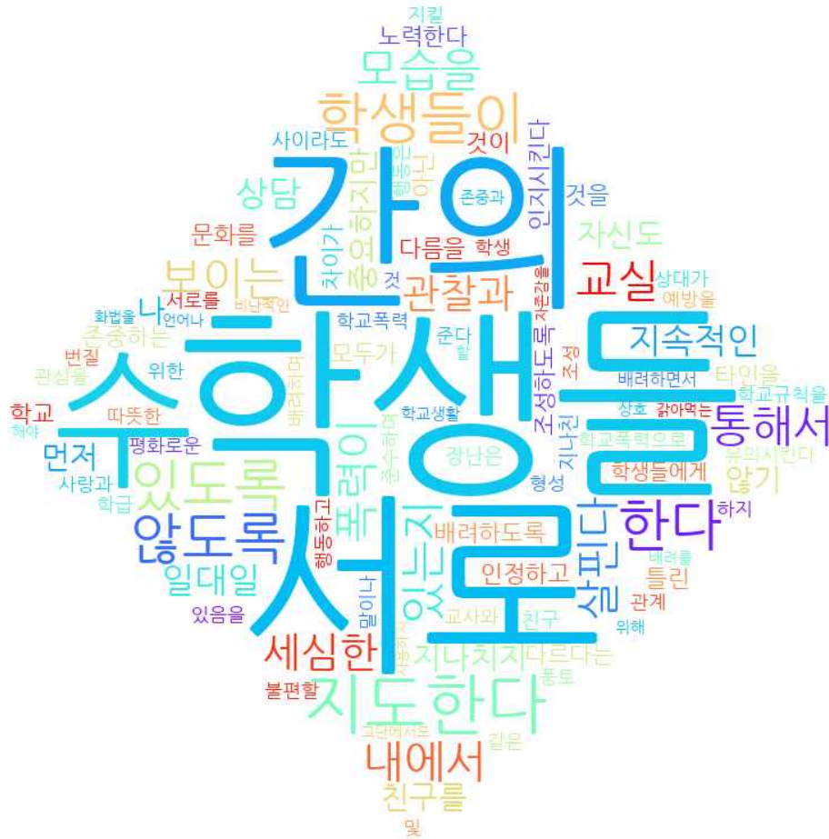
[그림: 교직원 ‘학교폭력예방’ 분야 워드클라우드]