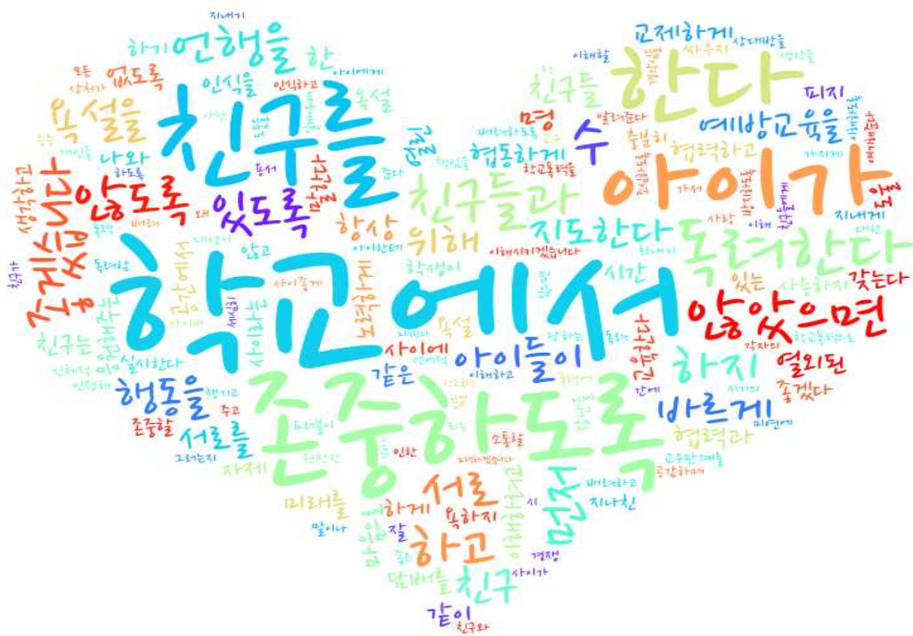
[그림: 2학년 학부모 ‘학교폭력예방’ 분야 워드클라우드]