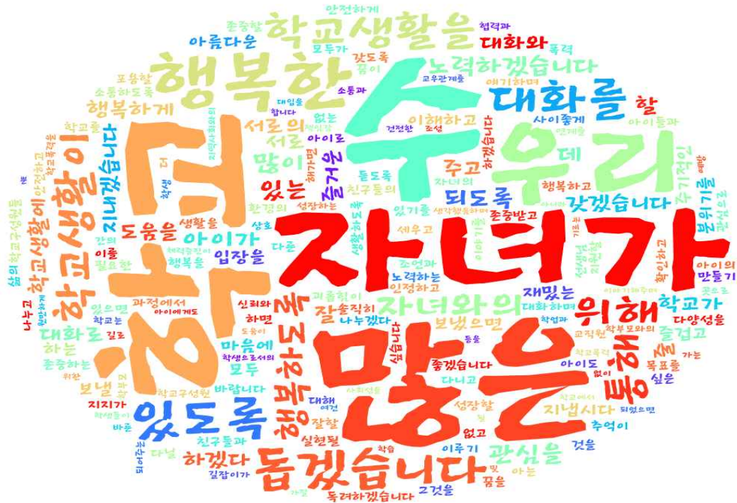
[그림: 3학년 학부모 '내가 바라는 바람직한 학교의 모습 및 내가 실천할 수 있는 약속' 분야 워드클라우드]