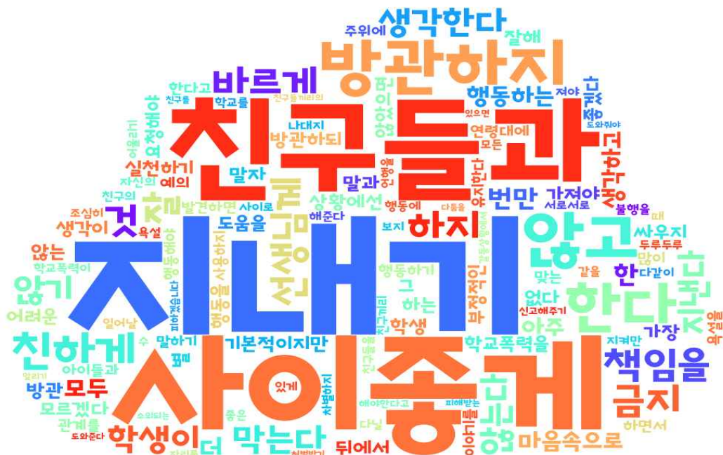
[그림: 2학년 학생 ‘학교폭력예방’ 분야 워드클라우드]