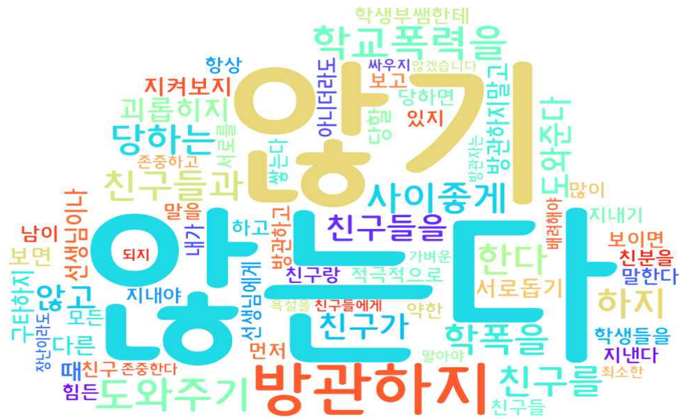
[그림: 1학년 학생 ‘학교폭력예방’ 분야 워드클라우드]