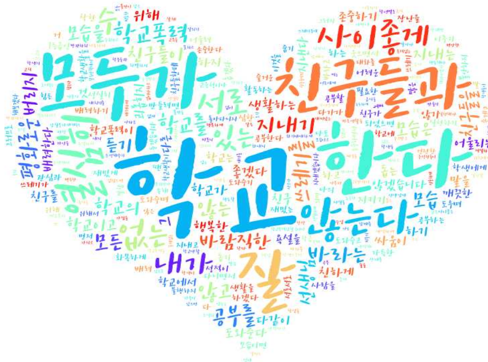
[그림: 전체 학생 ‘내가 바라는 바람직한 학교의 모습 및 실천 약속’ 분야 워드클라우드]