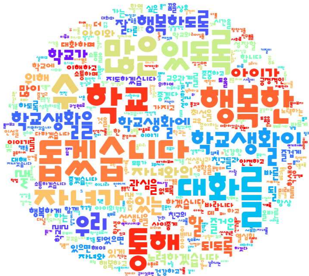
[그림: 전체 학부모 '내가 바라는 바람직한 학교의 모습 및 내가 실천할 수 있는 약속' 분야 워드클라우드]