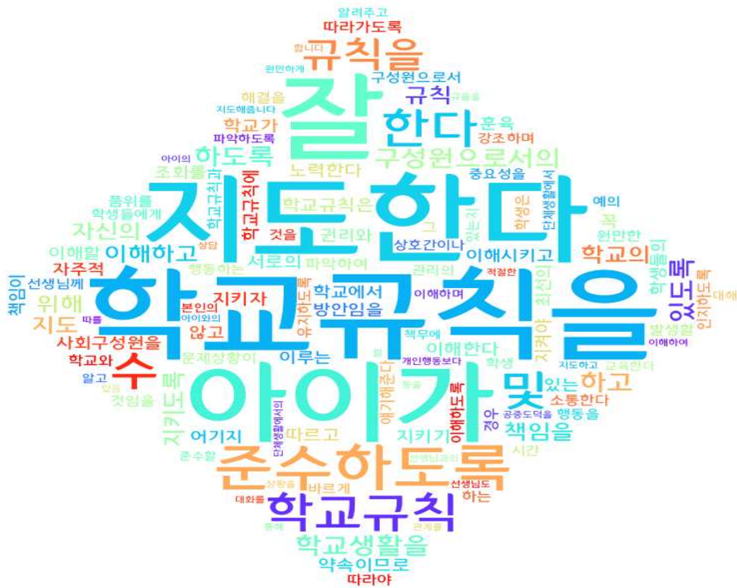
[그림: 3학년 학부모 ‘학생생활지도 이해’ 분야 워드클라우드]