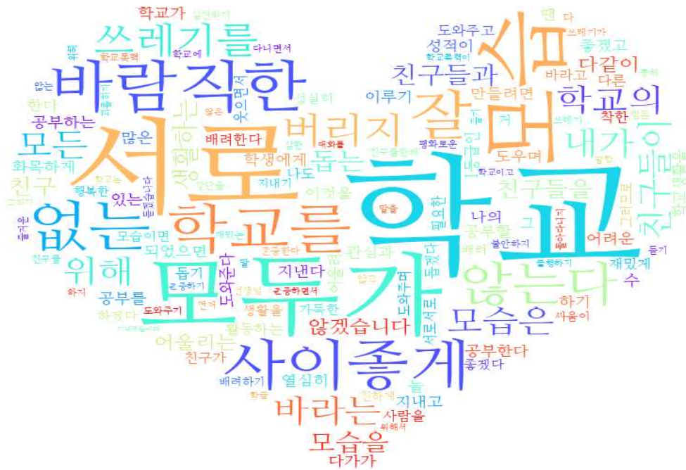
[그림: 1학년 학생 ‘내가 바라는 바람직한 학교의 모습 및 실천 약속’ 분야 워드클라우드]

☆ 내가 바라는 바람직한 학교의 모습 및 실천 약속에 대한 학생 제안 내용 알아보기 ☆