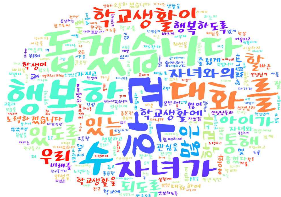
[그림: 2학년 학부모 ‘내가 바라는 바람직한 학교의 모습 및 내가 실천할 수 있는 약속’ 분야 워드클라우드]