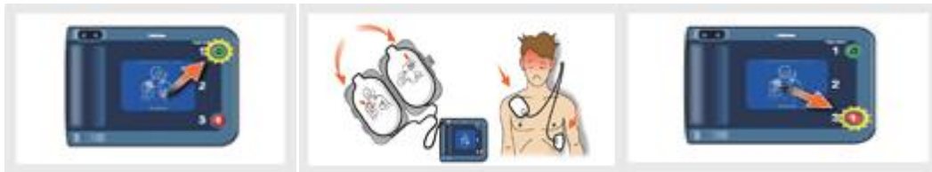
① 전원켜기 ② 2개의 패드 부착 ③ 심장 리듬 분석 ④ 제세동 시행

※ AED (자동 심장 제세동기) 사용법 - 심정지 같은 응급 상황 이외에는 절대 사용금지.