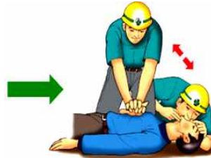
⑥ 가슴압박(30회)과 인공호흡(2회)