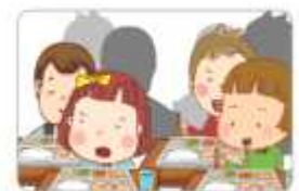
공공생활 구성원의 자질 함양