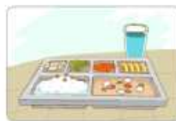
바른 식생활 습관 형성