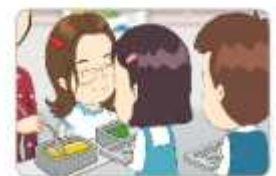
나눔과 배려, 공동체 의식 함양