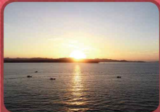
서천 마량포 해넘이·해돋이 행사 12. 31. ~ 1. 1. / 서면 마량포구