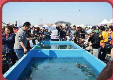
서천 동백꽃·주꾸미 축제 3월중 / 서면 마량포구