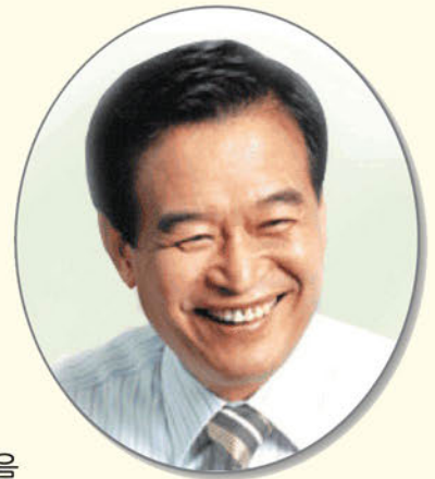
총 재 서 상 기