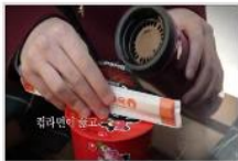
[학교2015 후아유] 학교...