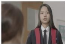
2016 학교폭력 예방 공...