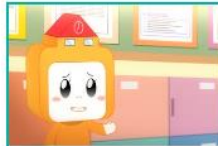
학교폭력 형태별 교육자...