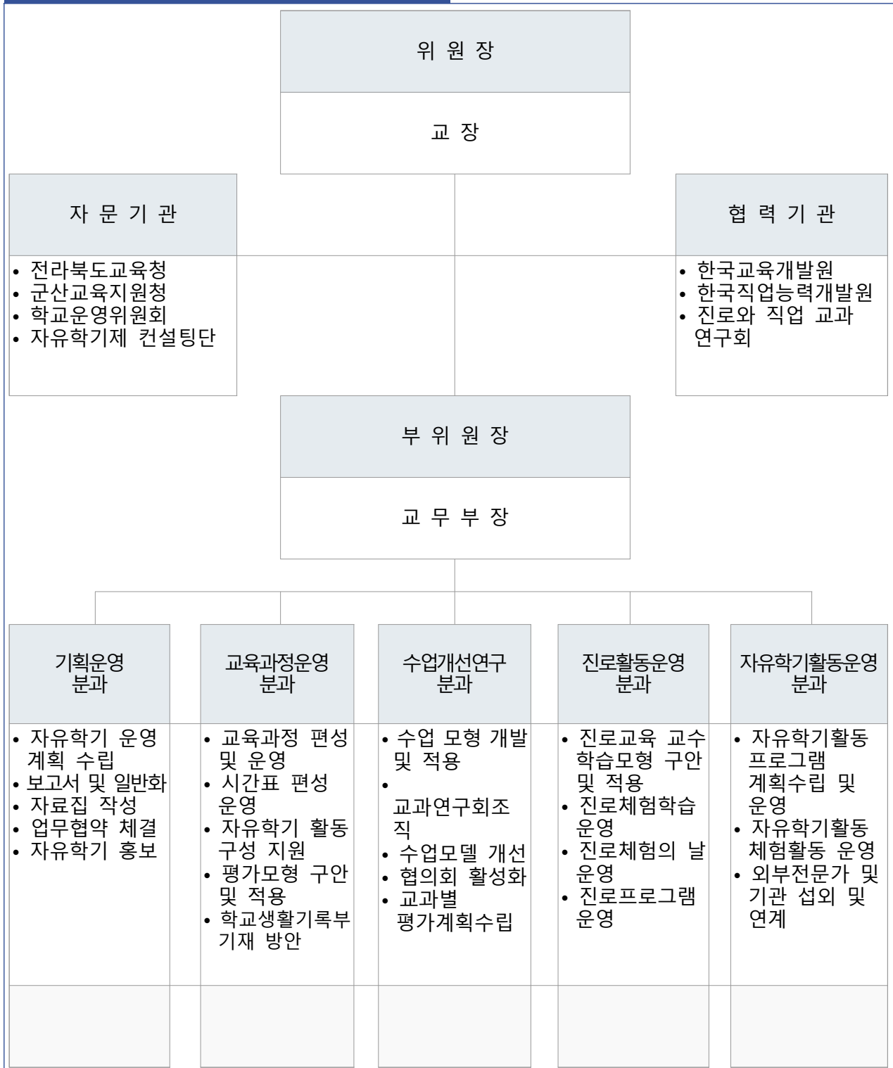
자유학기 운영 조직도(예시)

※ 자유학기 운영 관련 업무가 특정교사의 업무로만 인식되지 않도록 유의, 자유학기 활동으로 편성하는 대상 교과 및 시수는 교원의 협력적인 분위기를 바탕으로 교과 협의 등을 통해 결정함이 바람직함