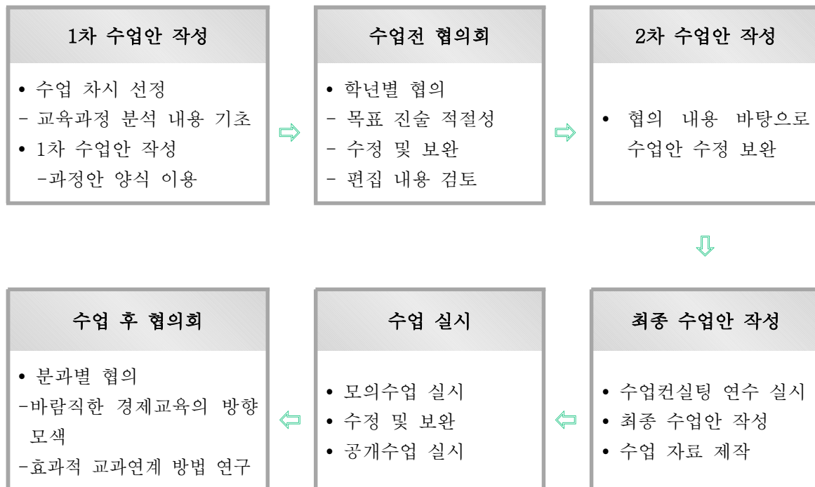
<표 V-10> 수업 협의 흐름도

교과연계 경제교육에서는 교과에서의 핵심성취기준과 초등학교 경제교육 성취기준 목표를 반영하여 교수학습 계획을 재구성하여, 이에 따른 교수·학습 과정안을 작성한다. 수업시간 또는 과제 해결 활동 시 이루어지는 다양한 체험을 통해 체계적인 경제교육이 이루어질 수 있도록 교수학습 계획을 수립하여 적용한다.