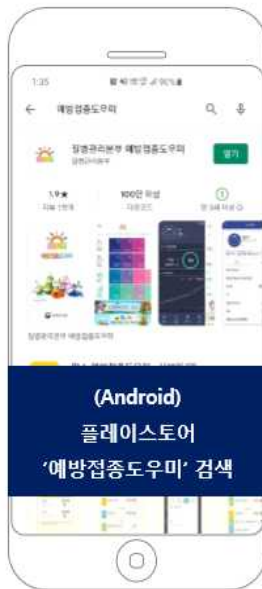
(Android) 플레이스토어 '예방접종도우미' 검색