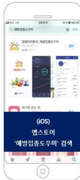
(iOS) 앱스토어 '예방접종도우미' 검색