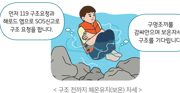
< 구조 전까지 체온유지(보온) 자세 >