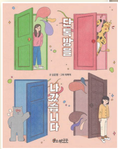
단독방을 나갔습니다 신은영, 소원나무, 2022