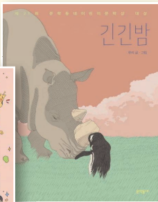
긴긴밤 루리, 문학동네, 2021