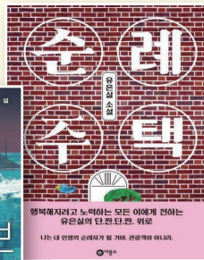
순례수택 유은실, 비룡소, 2021