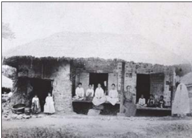
<1900년 초기의 기전여학교 모습>

지금으로부터 약 132년 전, 1893년에 미국 남장로교 소속 선교사 7명이 호남지방에 오면서 호남 선교가 시작됩니다. 군산으로 시작해서 전주로 선교지가 확장됩니다. 윌리엄 전킨 목사님은 군산, 김제, 익산에서 교회, 학교, 병원 등을 세우며 선교를 하다가 선교지를 전주로 이동하게 되었고 전주에서도 서문교회 담임, 순회 설교, 신흥학교 교장, 평양신학교 출강, 걸식아동을 돌보며 고아원을 세웠습니다. 그의 부인 메리 전킨 선교사님은 기전학교 1대 교장이 됩니다. 전킨 목사님은 과로로 폐렴을 유발하여 43세의 나이에 소천하셨습니다. 그의 마지막 말은 “나는 본향에 가서 매우 행복하다”는 것이었습니다. 전킨 목사님의 죽음은 선교사들에게 큰 슬픔이었습니다. 기억하고 기념하자, 전킨 목사님을!! 이렇게 해서 학교 이름이 기전학교가 되었습니다.