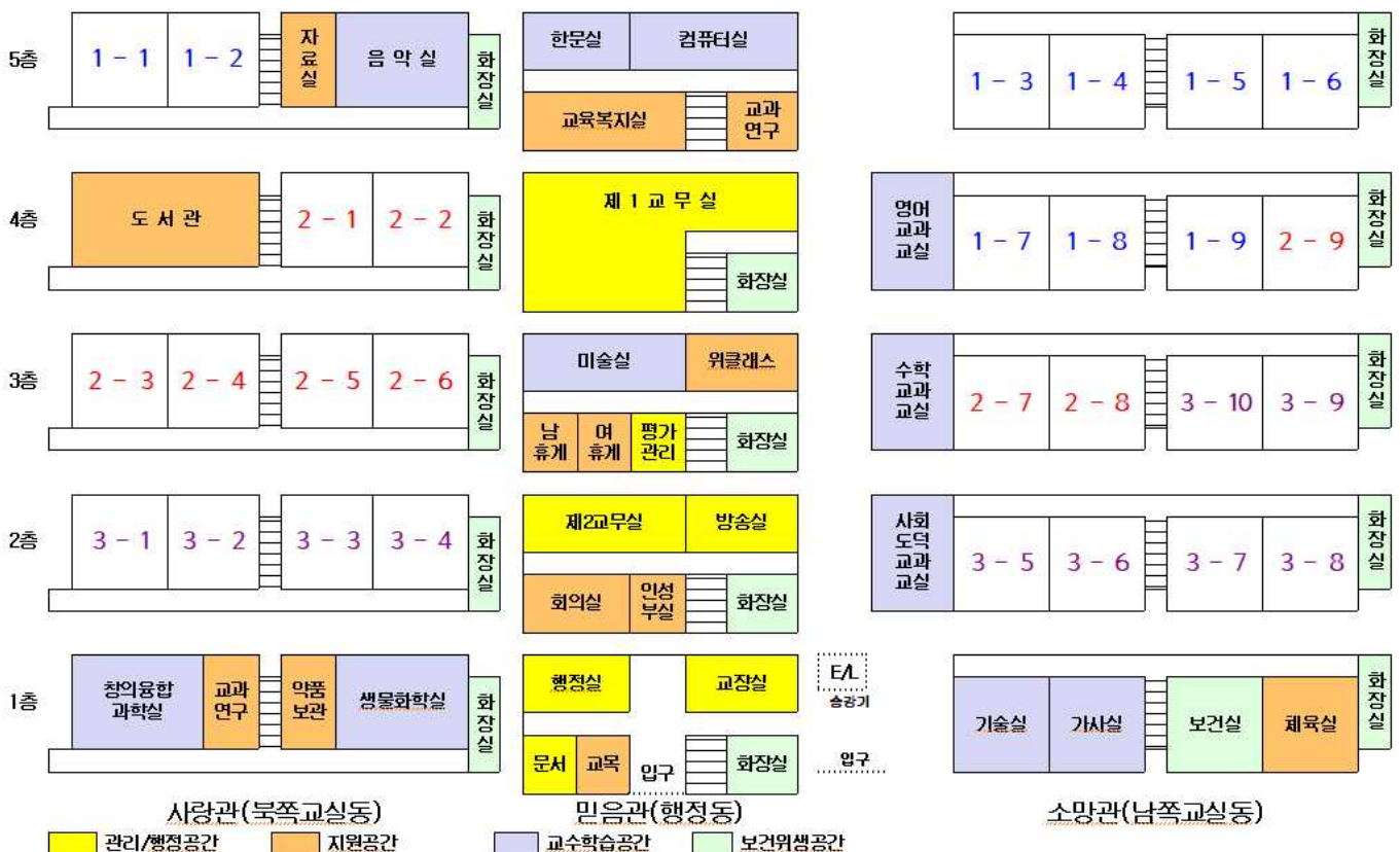
2022학년도 전주기전 중학교 배치도