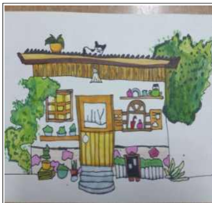
주변의 풍경들을 그려보는 어반스케치 작업