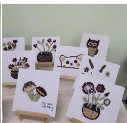
씨앗으로 그려보는 그림