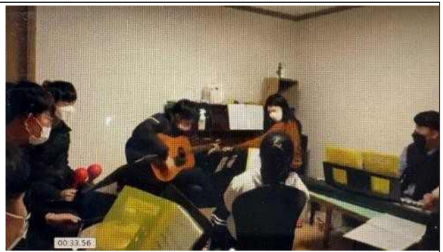
특수교육대상자의 음악활동 음악을 통해 취미를 돕고 타인과 상호작용을 통해 공동체 형성