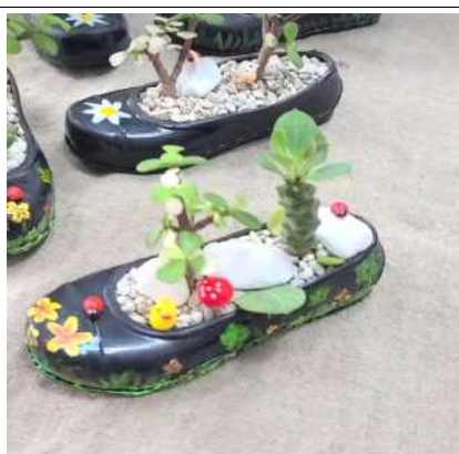
식물과 친근한 소품을 활용한 식물식재