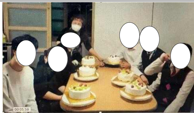
특수교육대상자의 요리활동 주방 소도구를 사용하여 자립에 필요한 요리체험