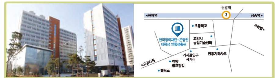
▲ 한국장학재단-은행권 대학생 연합생활관 전경