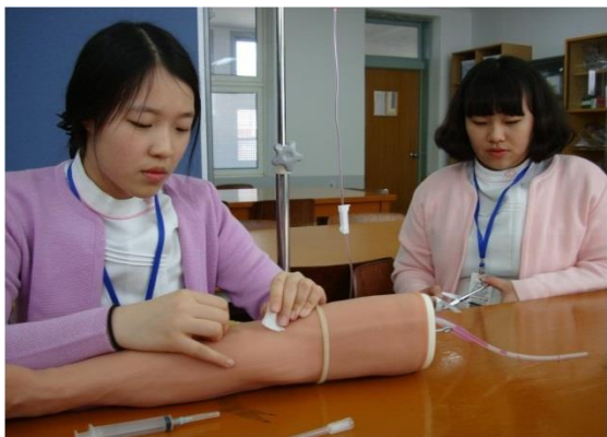
<보건간호과 수업 (간호조무사자격증)>