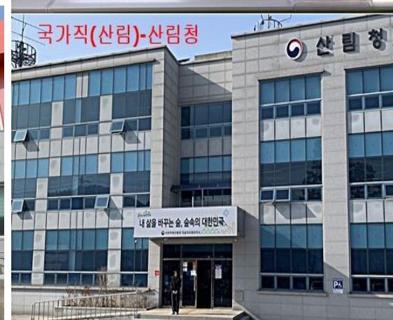
<본교 출신 공무원 근무모습>