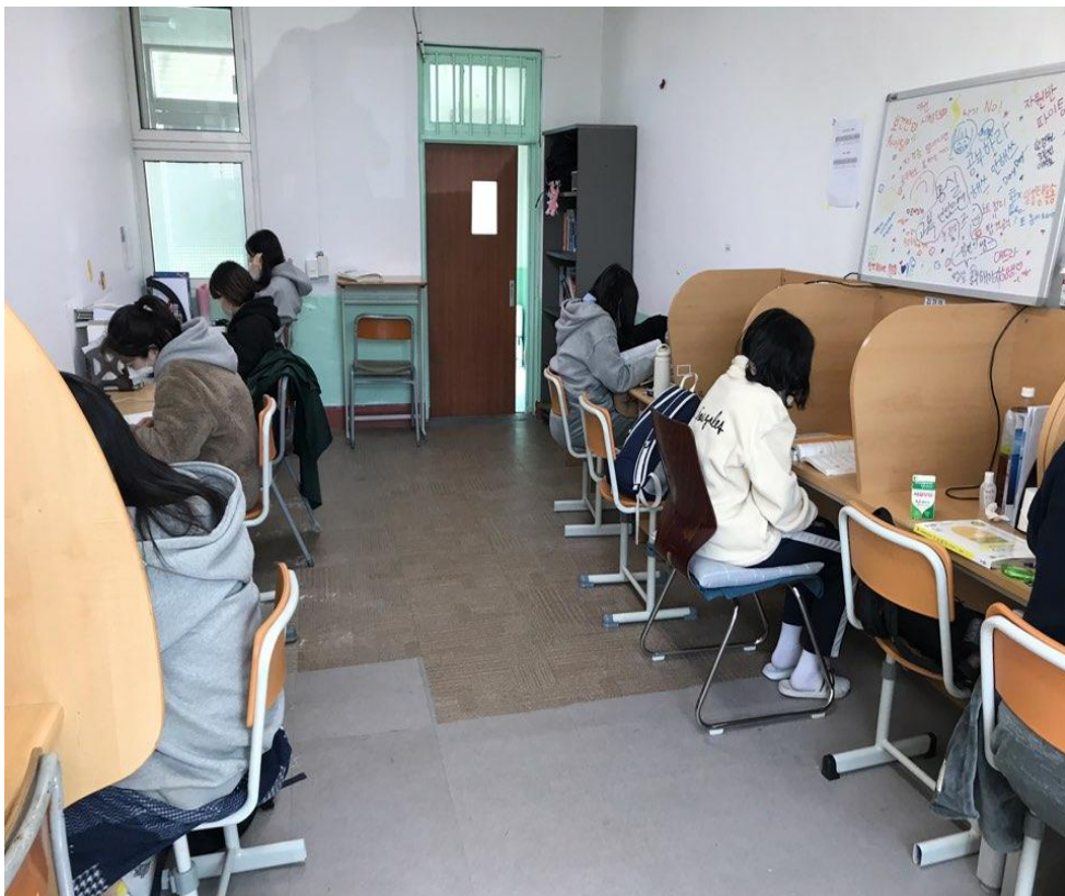
<공무원 학습실 운영 모습>