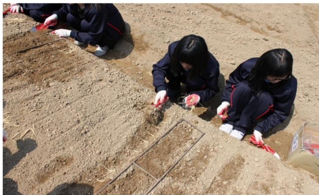
<한방생명과학과수업 유기농업 자격증>