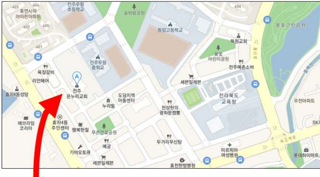
전주 온누리교회 주차장

○ 설명회당일 도교육청 내 주차 상황이 혼잡할 수 있습니다. 도교육청 내 주차가 어려울 경우 도교육청 근처 '온누리교회' 에 주차할 수 있습니다.