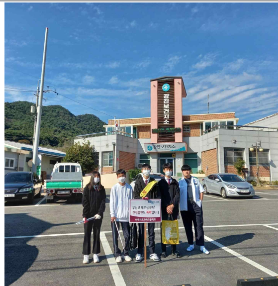
보건지소 앞에서 피켓활동