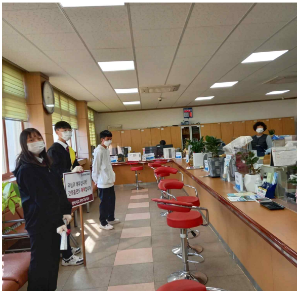
면사무소 선생님들 금연, 고맙습니다!