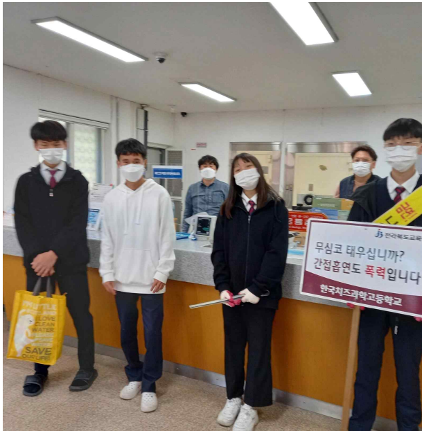
우체국 선생님도 금연, 감사 한 것~