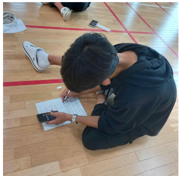
1년동안 나는 담배 값이 얼마나 들지- 계산기가 필요해요(7월12일)