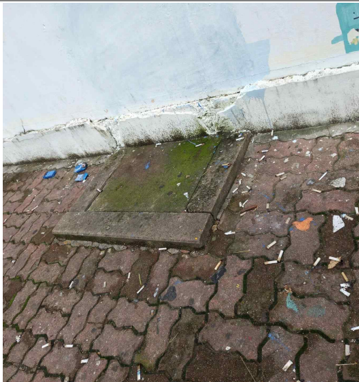
쓰레기가 또 쌓였어요(7월9일)