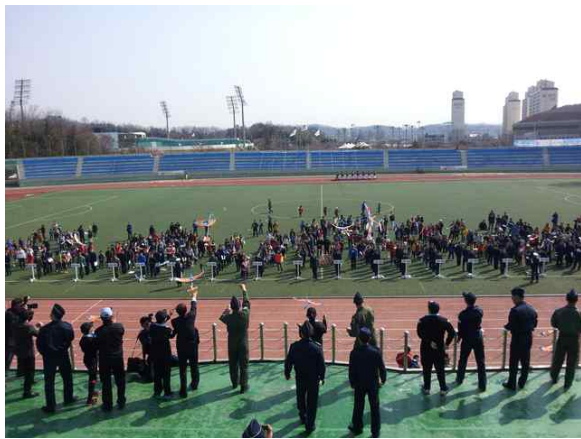
모형항공기 시범 비행