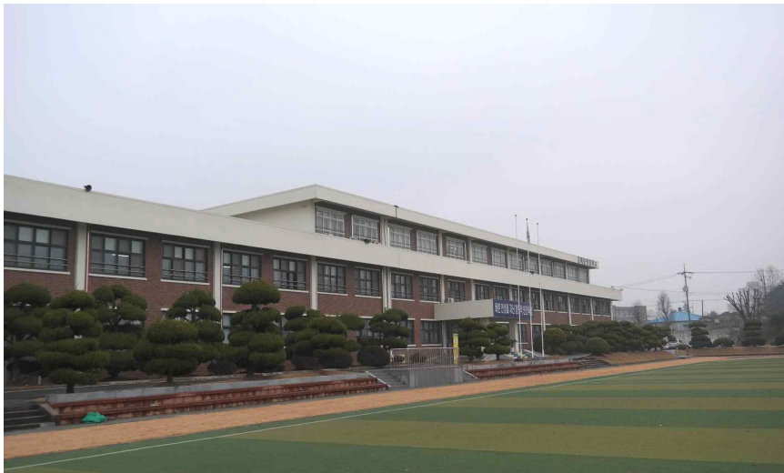
〈 김제중앙중학교 전경〉