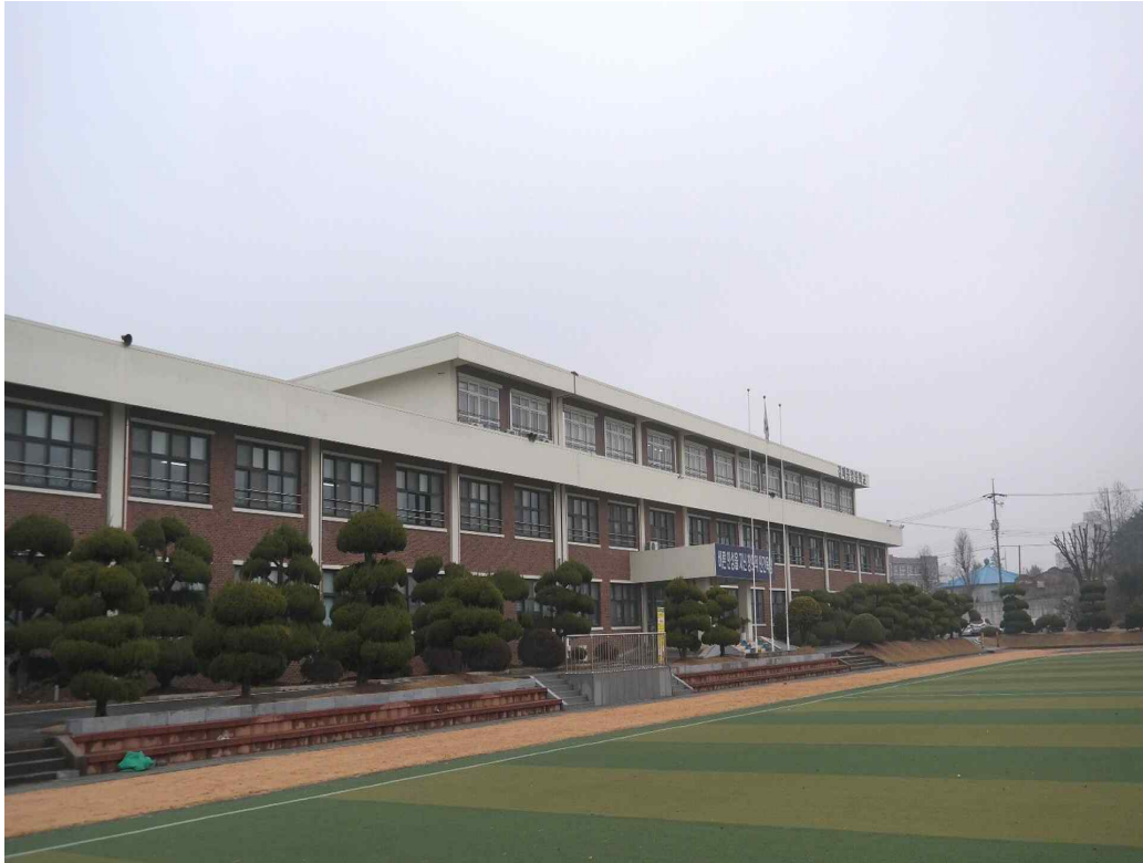
〈 김제중앙중학교 전경〉

54411 전라북도 김제시 남북 9길 52 교장실546-8551, 교무실547-5012, 행정실547-5011 급식실 547-5062 FAX (행정실) 547-0747