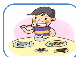
균형 잡힌 영양섭취