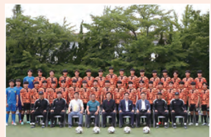
▲ 전주공고 동아리 (축구부)