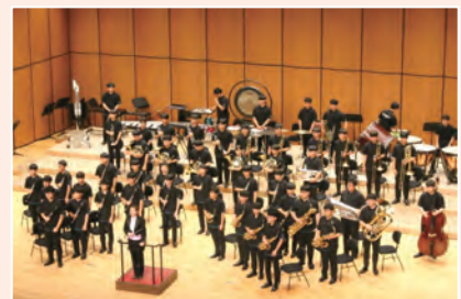
▲ 전주공고 동아리 (관악부)