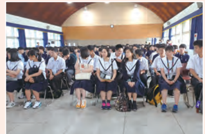
▲ 가나자와시립공업고등학교 본교 방문