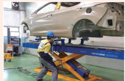
▲ 자동차 차체수리