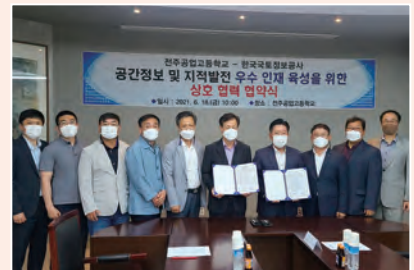
▲ 한국국토정보공사 상호협력 협약식