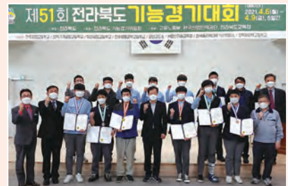
▲ 제51회 전북 기능경기대회