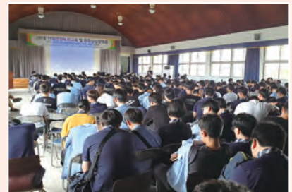
▲ 현장실습 설명회