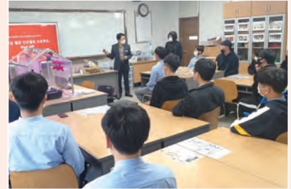
▲ 골든타임 별관 리모델링 프로젝트 과제 수행