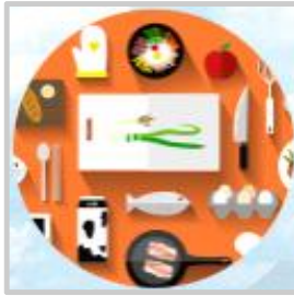
위생적으로 조리과정 준수하기 • 칼, 도마 소독하여 사용하기 • 조리도구는 구분하여 사용하기