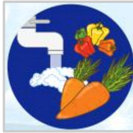
채소, 과일은 깨끗한 물에 씻어 껍질 벗겨 먹기