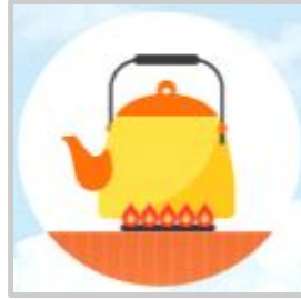
물은 끓여 마시기