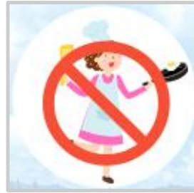
설사 증상이 있는 경우는 음식 조리 및 준비 금지

<자료 출처 - 진드기 매개 감염병 및 수인성/식품매개 감염병 예방 : 질병관리본부, 벌쏘임 예방 : 소방청>