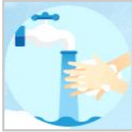
흐르는 물에 비누로 30초 이상 올바른 손씻기