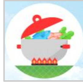
음식 익혀 먹기