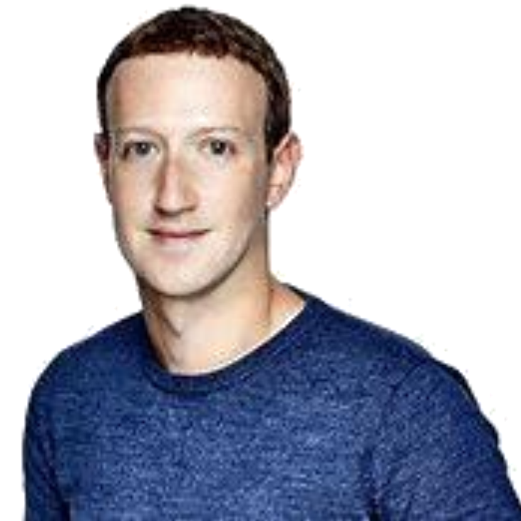
페이스북(현 메타)의 CEO 마크 저커버그

또한 현재는 게임 중심의 사업형태이지만, 피트니스와 SNS같은 형태로 확장될 것이라 말했다.